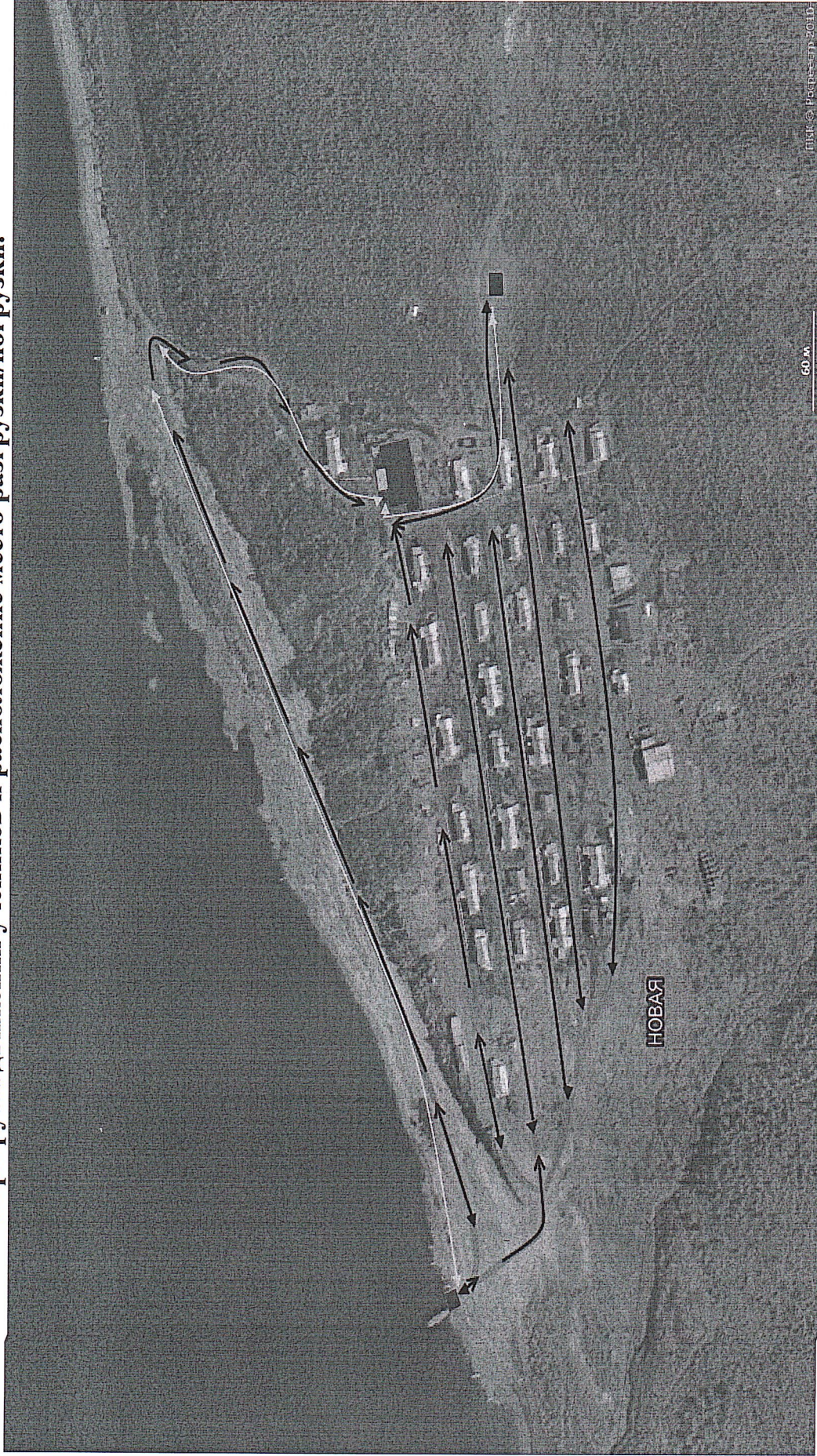
Схема организации дорожного движения в непосредственной близости от образовательного учреждения, маршруты движения учеников и расположение места разгрузки/погрузки.